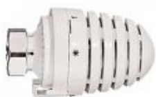
Føler Porche Design Passer til Danfoss