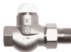
TS E ventil ekstra stor boring

VVS nr. 401724.004 1/2" VVS nr. 401724.006 3/4" VVS nr. 401724.008 1"