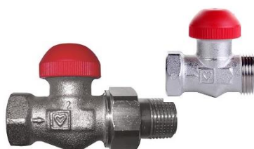
TS 90-V radiatorventil m/forindstilling

VVS nr. 401622.003 3/8" ligeløb. VVS nr. 401622.004 1/2" ligeløb. VVS nr. 401623.003 3/8" vinkeløb. VVS nr. 401623.004 3/8" vinkeløb.