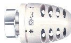
Mini føler frost sikr. 6°C