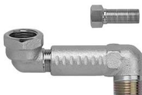
Excentrisk tilslutning 2 delt, kan afkortes

VVS nr. 405570.004 VVS nr. 405570.900 forlænger