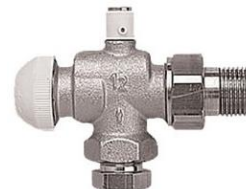
TS omvendt vinkeløbende m/luftskruer

VVS nr. 401622.003 3/8" ligeløb. VVS nr. 401622.004 1/2" ligeløb. VVS nr. 401623.003 3/8" vinkeløb. VVS nr. 401623.004 3/8" vinkeløb.