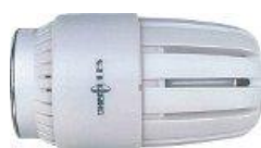
Herkules føler Frost sikr. 8°C

VVS nr. 403360.000 total afspærring VVS nr. 403361.000