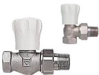
GP håndregulerede ventiler

VVS nr. 401712.003 3/8" ligeløb. VVS nr. 401712.004 1/2" ligeløb VVS nr. 401713.003 3/8" vinkeløb. VVS nr. 401713.004 1/2" vinkeløb.