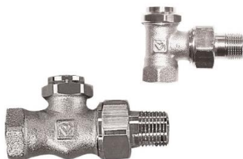
RL5 radiator forskrning m/forindstilling, afsp. & tøm/fyld funktion

VVS nr. 405430.003 3/8" ligeløb. VVS nr. 405430.004 1/2" ligeløb. VVS nr. 405431.003 3/8" vinkeløb. VVS nr. 405431.004 1/2" vinkeløb.