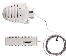
Standard fjernføler Frost sikr. 6°C, 2 meter kapl. rør