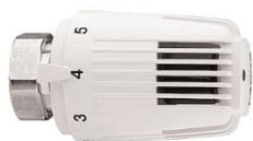
Standard fast føler Frost sikr. 6°C

VVS nr. 403360.000 total afspærring VVS nr. 403361.000