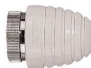
Håndhjul til TS ventil